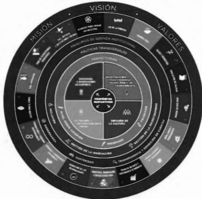
Gráfica 2: Estructura conceptual del Plan de Desarrollo Institucional 2019-2025, Visión 2030

"Ninguna meta educativa debería considerarse lograda a menos que se haya logrado para todos". Unesco. Declaración de Incheon, Marco de Acción (2013)